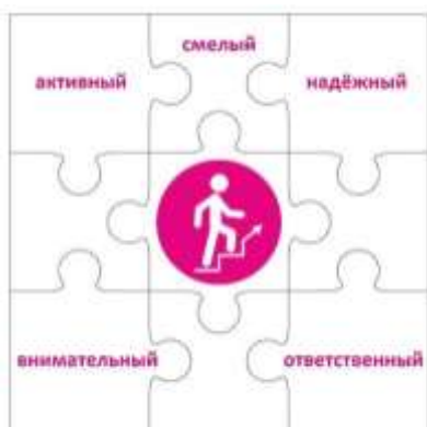
Конструктор «Лидер» 2 класс

Чтобы быть лидером, нужно много знать, уметь вести за собой, постоянно развиваться. Личность лидера многогранна, она словно складывается из множества разных пазлов, которые в целом дают яркую и интересную картинку. Конструктор «Лидер» представляет собой большой пазл, где центральный элемент – символ трека – человечек, поднимающийся вверх по лестнице. Остальные части этого пазла – элементы небольшого размера, примерно формата, на каждом из которых в левом верхнем углу написаны по одной букве из алфавита.