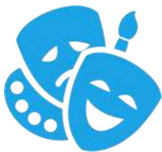
Логотип трека «Орлёнок – Мастер»