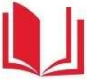
Логотип трека «Орлёнок – Эрудит»