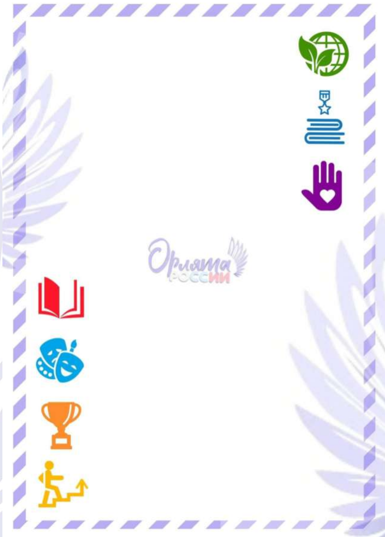
Рис. 2. Обратная сторона «Письма в Будущее».