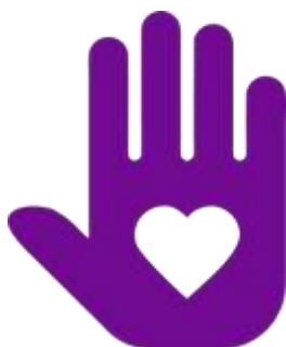
Логотип трека «Орлёнок – Доброволец»

Реализация трека проходит для ребят 1-х классов в начале декабря, но его тематика актуальна круглый год. Важно, как можно раньше познакомить обучающихся с понятиями «доброволец», «волонтёр», «волонтёрское движение». Рассказывая о тимуровском движении, в котором участвовали их бабушки и дедушки, показать преемственность традиций помощи и участия. В решении данных задач учителю поможет празднование в России 5 декабря Дня волонтёра.