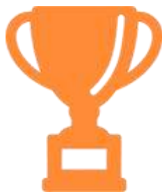
Логотип трека «Орлёнок – Спортсмен»

Ценности, значимые качества трека: здоровый образ жизни