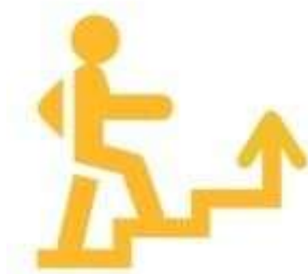
Логотип трека «Орлёнок – Лидер»

Ценности, значимые качества трека: дружба, команда